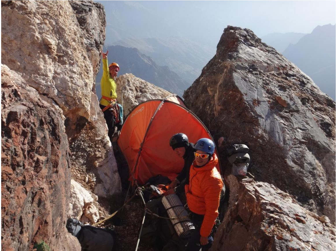
Bilde 5. Otrā nometne, stacija R25