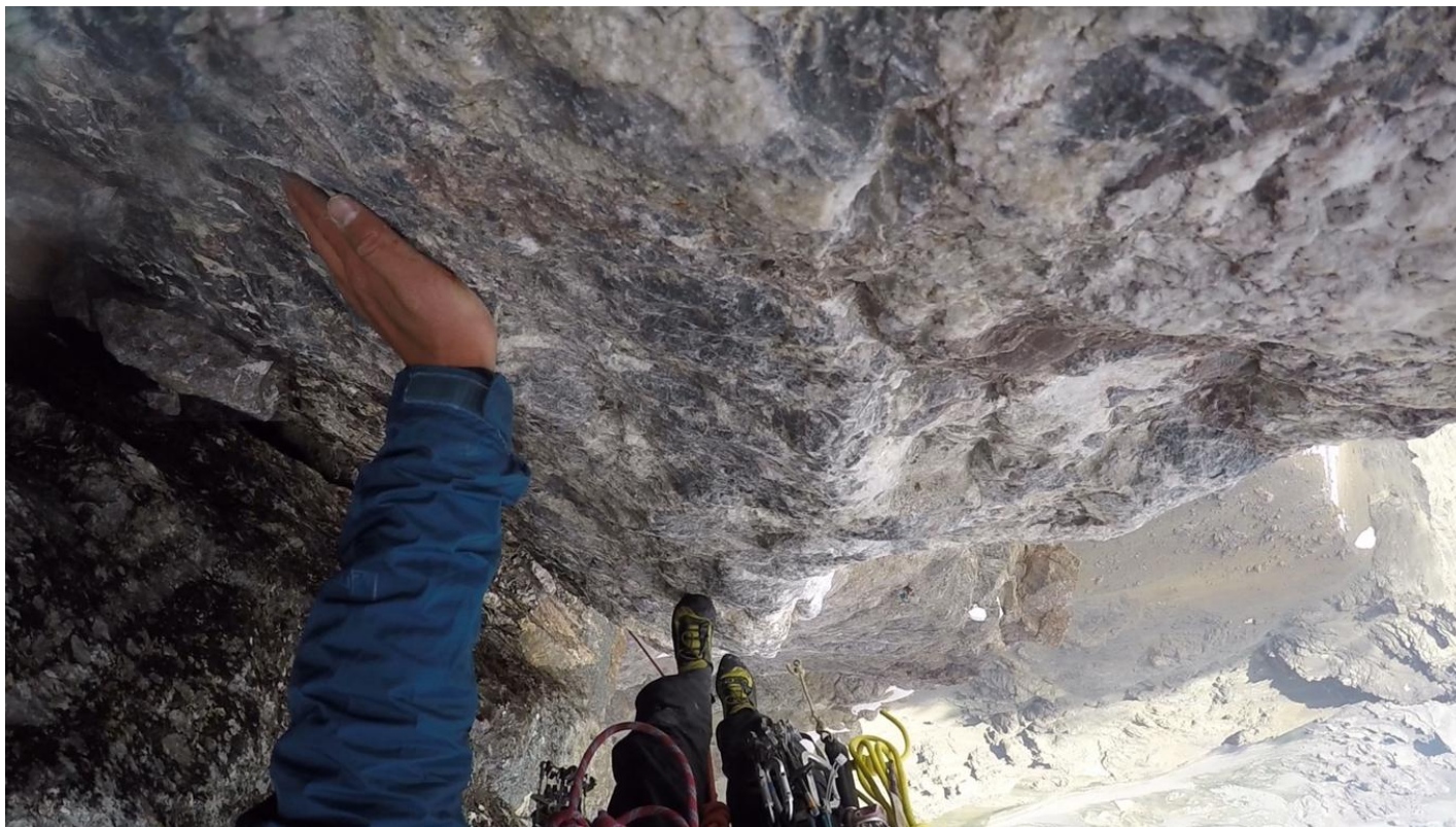
Bilde 2. Kāpšana posmā R12-R13