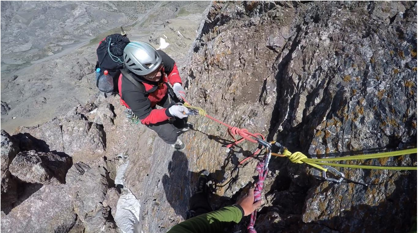
Bilde 1. Pacelšanas pie stacijas R10