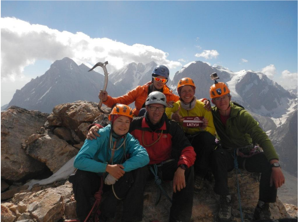
Bilde 6. Uz Adamtaš virsotnes