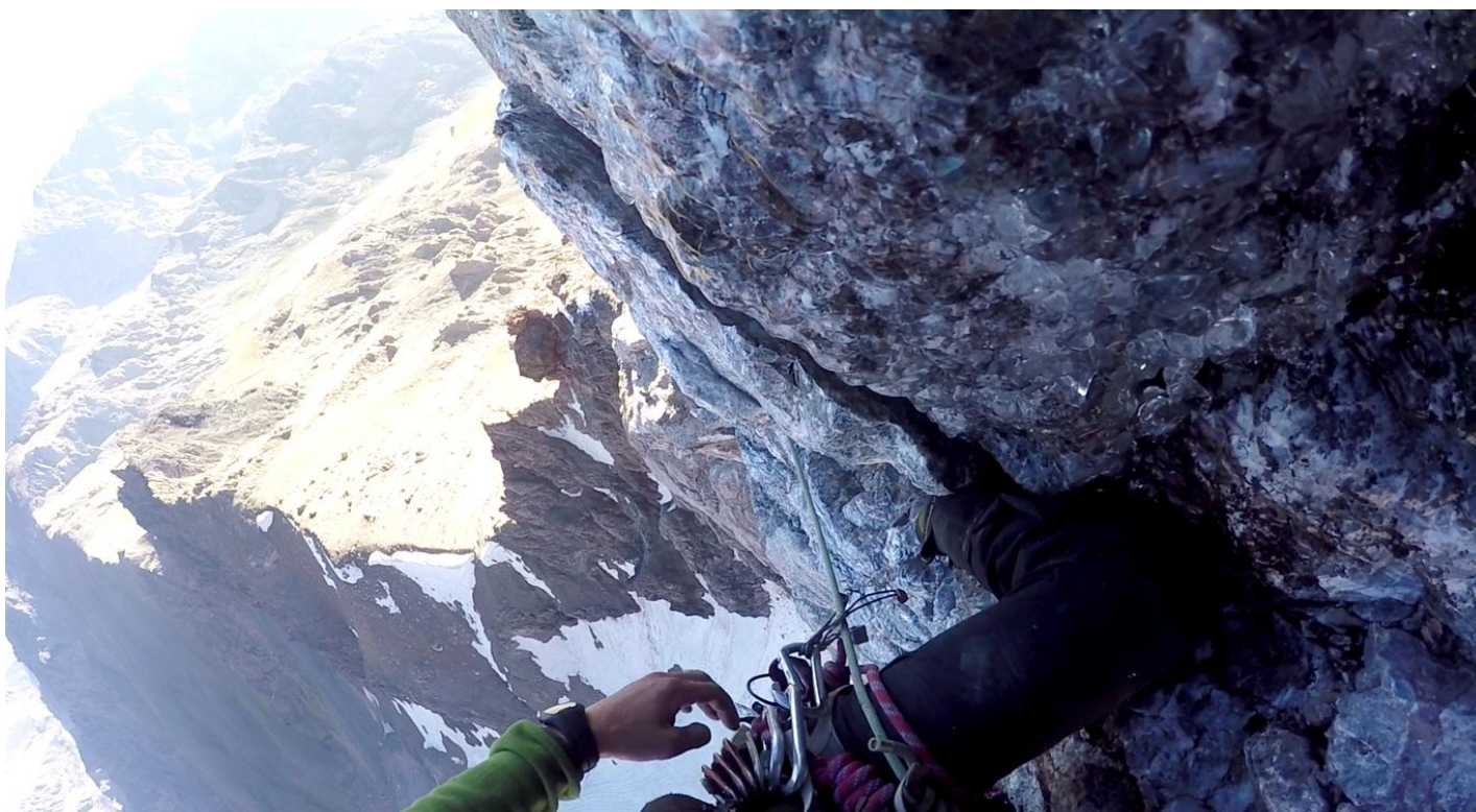
Bilde 3. Kāpšana pa apledojumu posmu R13-R14