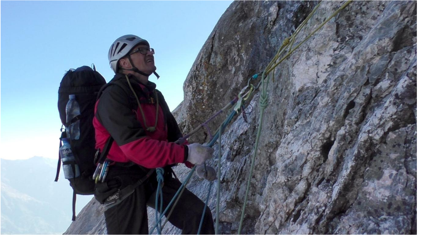
Bilde 4. Drošināšana apledojumā posmā, stacija R14