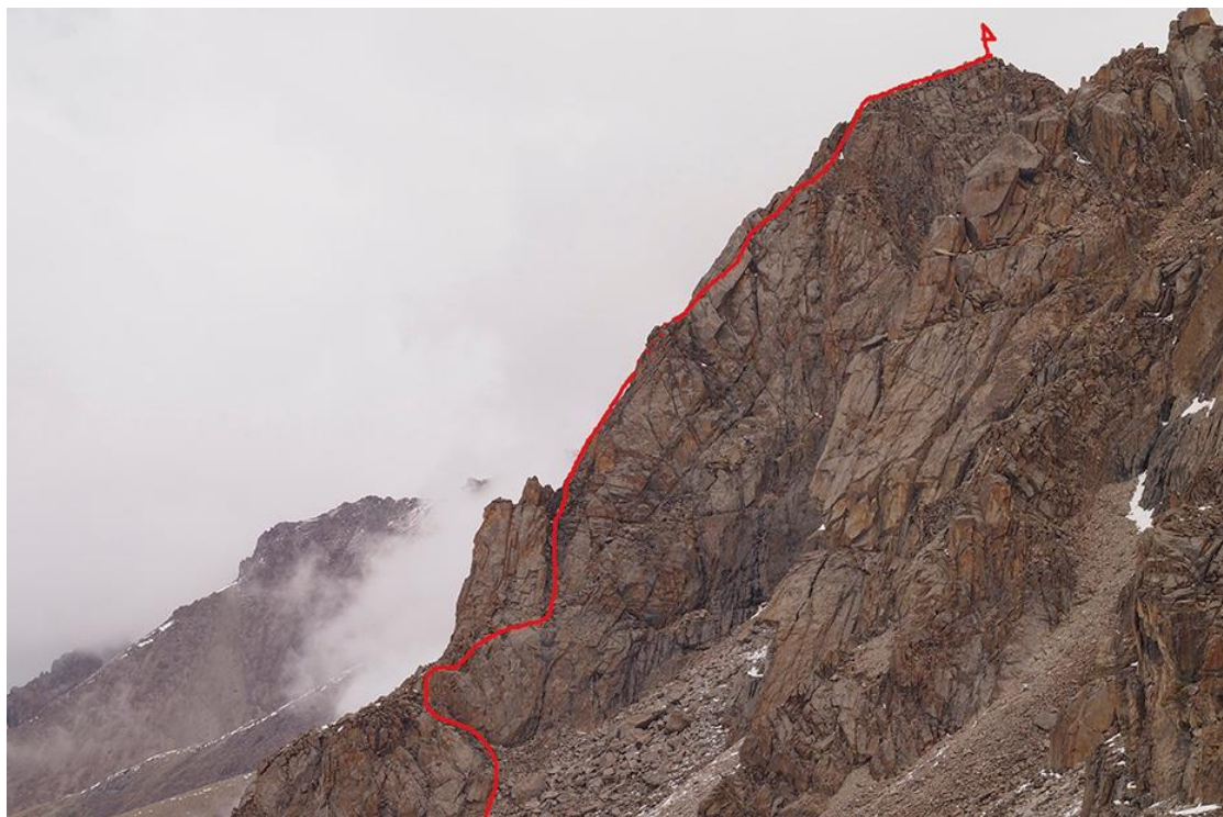
Maršruta bilde no risk.ru lapas internetā (skatpunkts no dienvidu puses)