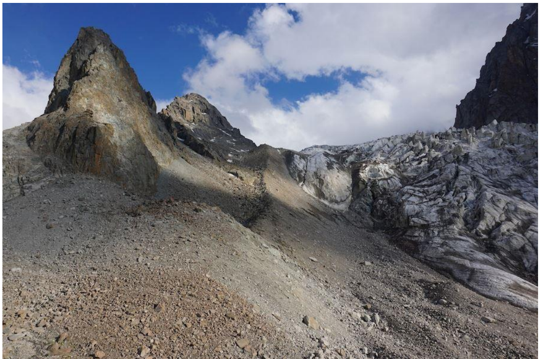
Raceka smaile (otrā no kreisās puses) no naktsmītņēm.